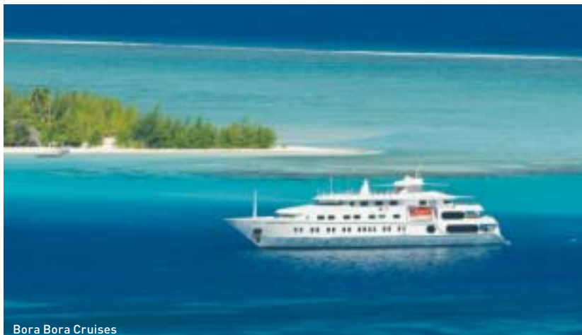
Bora Bora Cruises