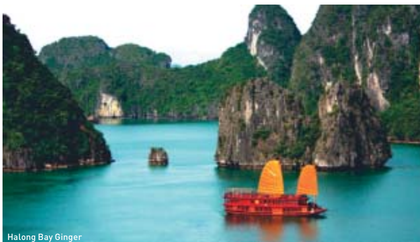
Halong Bay Ginger