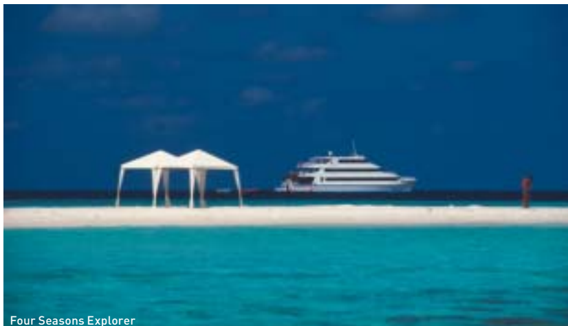
Four Seasons Explorer