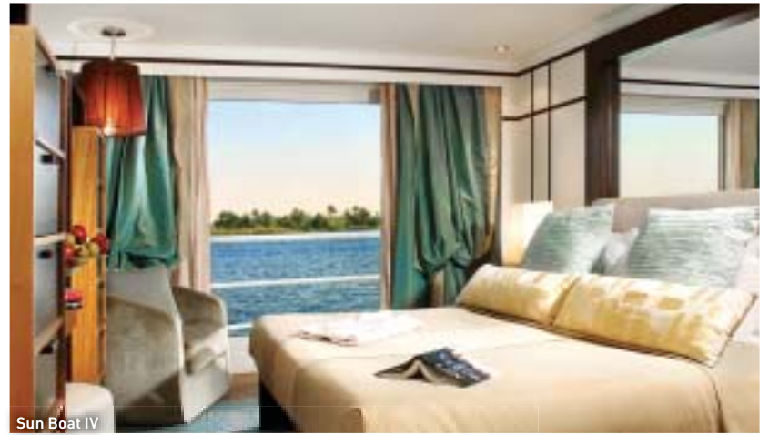
Sun Boat IV