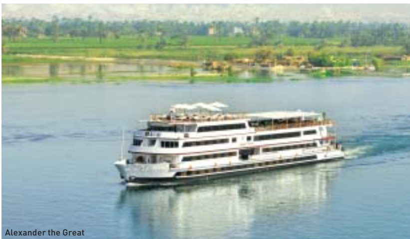
Alexander the Great